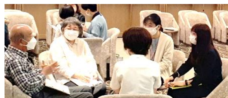
交流会の様子。グループ内の司会役として参加。(右)