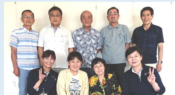
シニアの暮らし便利帳実行委員メンバー

冊子作成のメンバーは総代、民生委員、学区福祉委員や地域活動に積極的な方で、当事業所は事務局として参加しています。